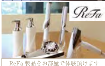
ReFa 製品をお部屋で体験頂けます