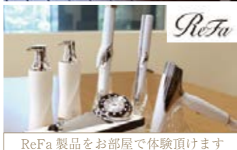
ReFa 製品をお部屋で体験頂けます