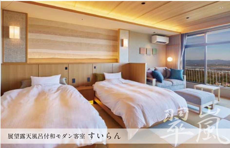
展望露天風呂付和モダン客室 すいらん