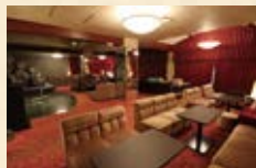
東館8階 クリスタル 最大 70 名

二次会カラオケ（2時間） 「飲み放題プラン」 お1人様 3,740円～ ※最低保障人数制有