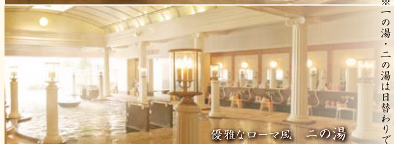
優雅なローマ風 二の湯