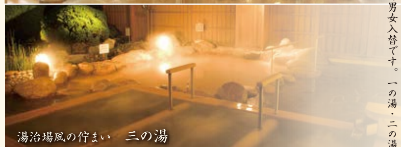
湯治場風の佇まい 三の湯