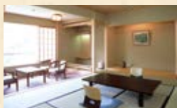
南館客室（禁煙） お1人様 2,200円アップ