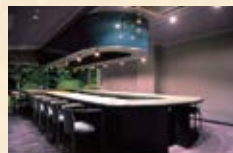
東館8階 [ 辛夷 ] こぶし 最大 25 名