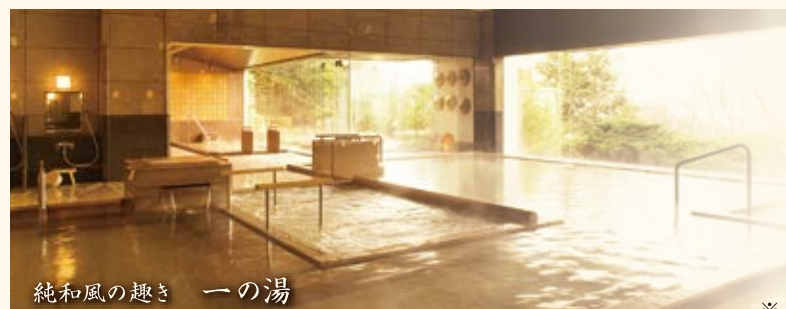
純和風の趣き 一の湯

※一の湯・二の湯は日替わりで男女入替です。一の湯・二の湯はサウナを併設しています。