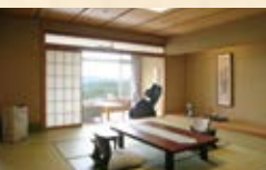
北館客室（禁煙） ●マッサージチェア付 お1人様 4,400円アップ