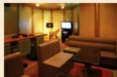
東館8階 [ 薔薇 ] ばら 最大 20 名