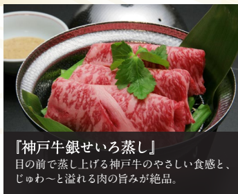
『神戸牛銀せいろ蒸し』 目の前で蒸し上げる神戸牛のやさしい食感と、じゅわ〜と溢れる肉の旨みが絶品。

西館客室(禁煙) 平日2名様1室 お1名様 29,040 円(税込)〜 ご夕食・ご朝食ともレストランにてバイキング