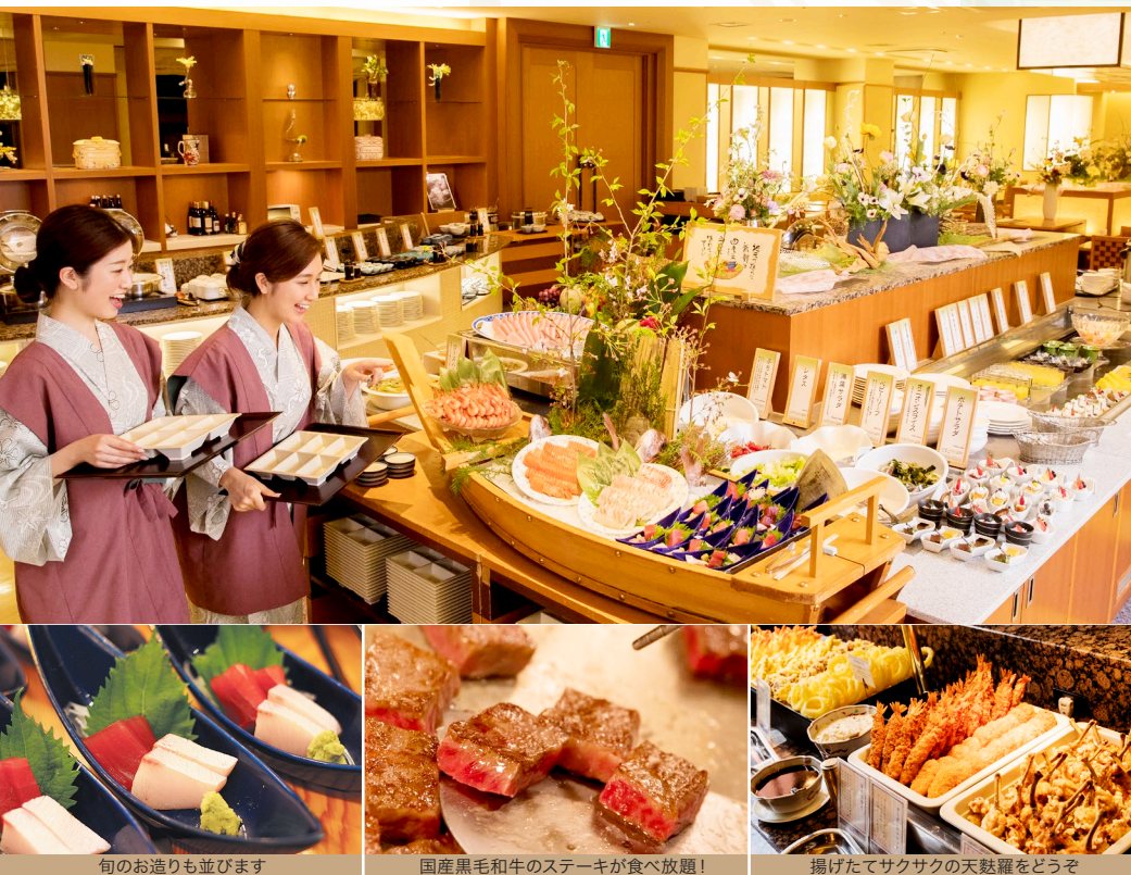
旬のお造りも並びます

※混雑時の食事開始時刻は 17:30・17:45・19:30 のいずれかになります。 ※お食事時間は 90 分間となります。