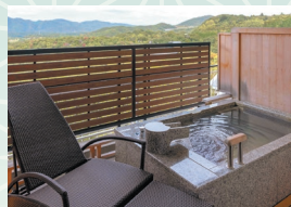
露天風呂付和モダン客室(禁煙)

西館の最上階にある1室限りのお部屋です。ビューパスの他、お食事や寛ぎの場としてご利用いただけるダイニングルームもございます。マッサージチェアとコーヒーセット付。