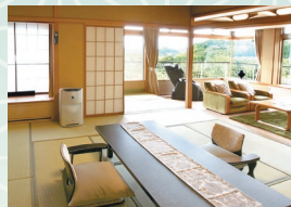
北館副室付特別室(禁煙)

西館の最上階にあり、露天風呂とマッサージチェアを備え、ゆったりと優雅なひと時をお楽しみいただけるお部屋です。 ※露天風呂のお湯は温泉ではありません。