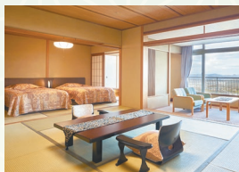
北館ベッドルーム付客室(禁煙)

北館最上階の角部屋で、広々として眺めの良い1室限りのお部屋です。お部屋からの眺めはまさに絶景。マッサージチェア付