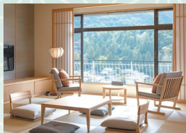
コーナースイート(禁煙)

西館の最上階にある1室限りのお部屋です。ビューパスの他、お食事や寛ぎの場としてご利用いただけるダイニングルームもございます。マッサージチェアとコーヒーセット付。