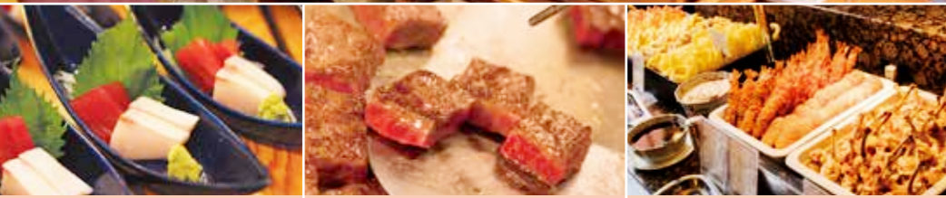
旬のお造りも並びます 国産黒毛和牛のステーキが食べ放題! 揚げたてサクサクの天麩羅をどうぞ