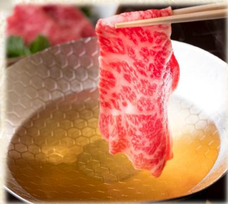
しゃぶしゃぶ(一人鍋)