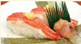
蟹の旨みと甘みが口いっぱい広がる、 カニ好きにはたまらない一品。